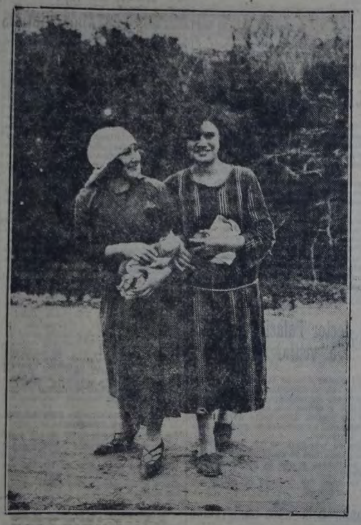
DOS OBRERAS DE GERLI POSANDO PARA "LA VANGUARDIA"

Y para remarcar sus afirmaciones, añadía: "¡Oh, señores diputados, a las puertas de las fábricas! ¡Ved salir a las obreras, niñas enfermizas, los ojos sin vida, el cutis pálido y sin encanto; semejan figuras escapadas de un cuadro de Willet! Llevan estampado en el rostro el estigma de la anemia, marchan como sacres para quienes la tierra es hermosa, para quienes el ideal no existe!" Tal es la realidad que nos ofrece el sistema de explotación capitalista, mal que los pese a los interesados panegiristas del presente régimen social. Los detentadores de los bienes colectivos no vacilan en aprovecharse de la situación de desamparo de la mujer obrera para explotar intensamente el trabajo de ésta. En su afán de obtener la mayor utilidad del empleo de sus capitales y del uso de los instrumentos productivos, los patronos tratan generalmente de recurrir a la mano de obra barata, es decir, a la que retribuyen su contribución creadora con un salario tan insignificante como merquino. Esa "mercancía" explotable a satisfacción del especulador, la buscan y encuentran los industriales entre las masas proletarias desorganizadas, sin nociones de solidaridad, de escasa o ninguna instrucción, y también entre las mujeres y niños, que resultan presionados para sus ambiciones presenciamen-